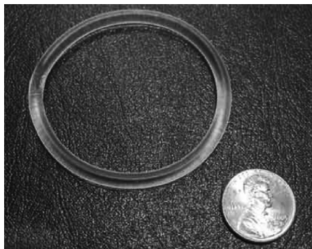
Рис. 7.1. Контрацептивное вагинальное кольцо рядом с монетой пени для сравнения размеров

ЭНГ/ЭЭ КВК представляет собой гибкое кольцо, выполненное из полимера этиленвинилацетата (ЭВА), того же пластика, что используется в изготовлении этоноргестрелового контрацептивного имплантата, пакетов для крови, глазных вкладышей и других медицинских устройств. Оно имеет диаметр 54 мм. Уникальная запатентованная конструкция, которая включает противозачаточные стероидные гормоны в матрице ЭВА, позволяет иметь диаметр поперечного сечения всего 4 мм, половину толщины колец, доступных для заместительной терапии эстрогенами в менопаузе (рис. 7.1). Большая часть кольца состоит из полупрозрачной смеси полимер/гормон, покрытой тонким (0,1 мм) наружным слоем, состоящим из одного только полимера. Наружный слой обеспечивает высвобождение гормона в течение долгого времени.