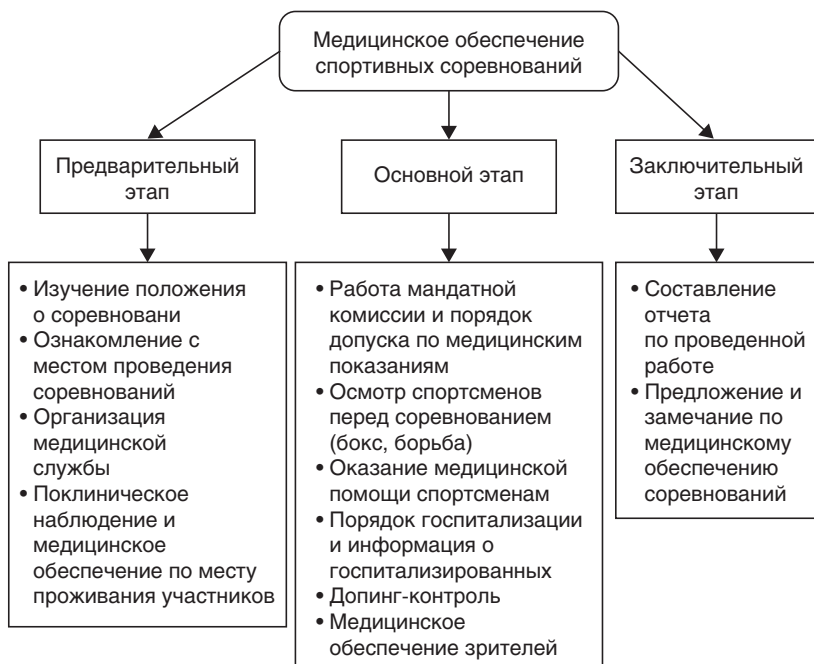
Рис. 1.4. Этапы медицинского обеспечения спортсменов, участвующих в соревнованиях