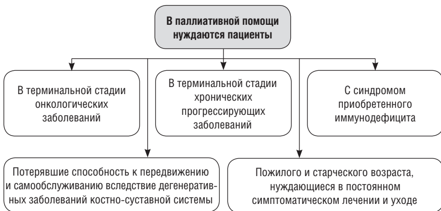
Рис. 1.1. Необходимость в паллиативной помощи