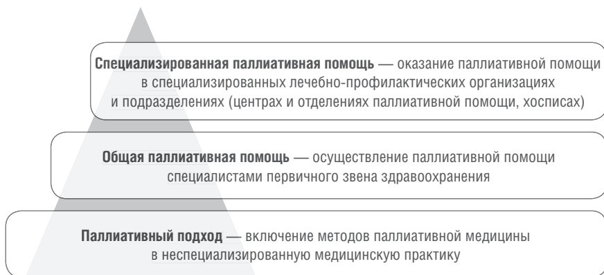
Рис. 1.2. Структура паллиативной медицинской помощи

При оказании паллиативной медицинской помощи в стационарных условиях осуществляется обеспечение граждан лекарственными препаратами для медицинского применения, включенными в Перечень жизненно необходимых и важнейших лекарственных препаратов. Больным с онкологическими и гематологическими заболеваниями, не имеющим группы инвалидности, с муковисцидозом, детским церебральным параличом, синдромом приобретенного иммунодефицита (СПИД) и другими заболеваниями бесплатные рецепты на необходимое лекарство должны выписывать на основании постановления Правительства РФ от 30.07.1994 № 890 «О государственной поддержке развития медицинской промышленности и улучшении обеспечения населения и учреждений здравоохранения лекарственными средствами и изделиями медицинского назначения» согласно региональному перечню лекарств, содержащемуся в территориальной программе государственных гарантий оказания гражданам бесплатной медицинской помощи на текущий год.