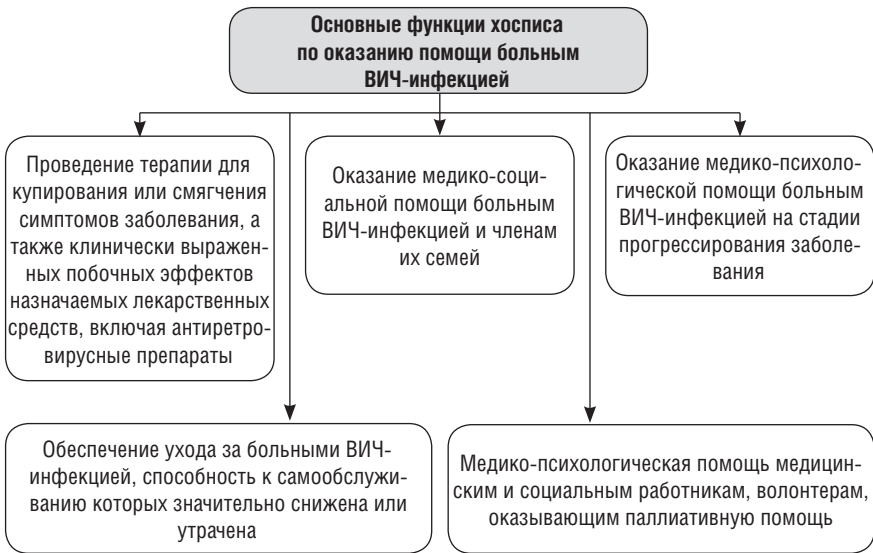
Рис. 1.4. Основные функции хосписа по оказанию помощи больным ВИЧ-инфекцией

Директором больницы (дома) сестринского ухода может быть медицинская сестра с высшим сестринским образованием или с повышенным уровнем среднего профессионального образования (табл. 1.5).